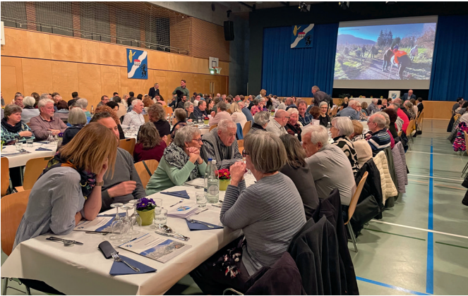
Bürgerversammlung vom 28. Februar 2025