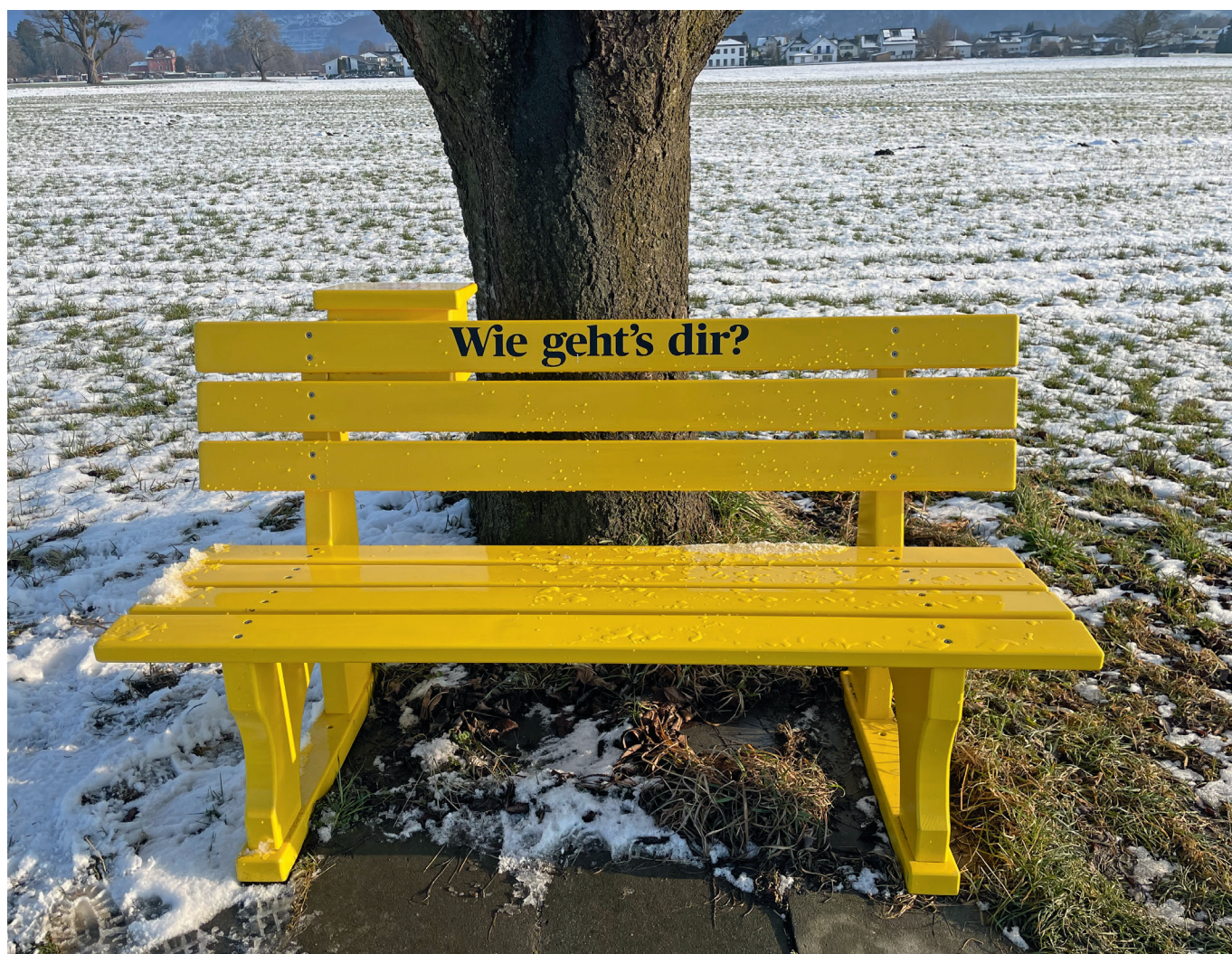
Wie geht's dir? – Bänkli im Nollen